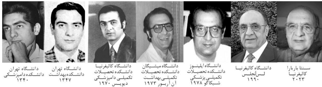
سنتا باربارا کالیفرنیا ۲۰۲۳ دانشگاه کالیفرنیا لس آنجلس ۱۹۹۰ دانشگاه ایلینوز دانشکده تحصیلات تکمیلی پزشکی شیکاگو ۱۹۷۸ دانشگاه میشیگان دانشکده تحصیلات تکمیلی بهداشت آن آربرور ۱۹۷۲ دانشگاه کالیفرنیا دانشکده تحصیلات تکمیلی دامپزشکی دیویس ۱۹۷۰ دانشگاه تهران دانشکده بهداشت ۱۳۴۷ دانشگاه تهران دانشکده دامپزشکی ۱۳۴۰