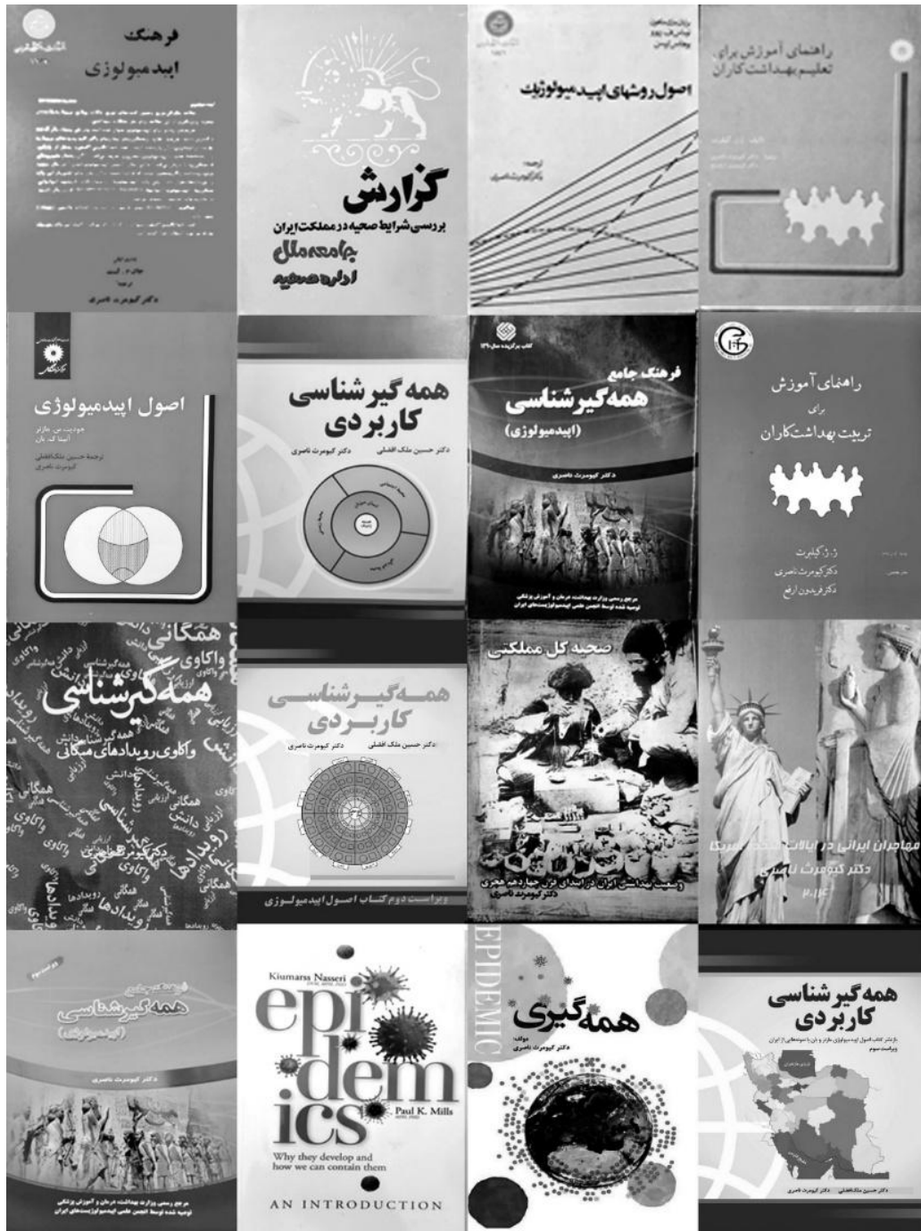
تصویر ۶- تصویر کتب منتشر شده دکتر کیومرث ناصری در طول سال ها