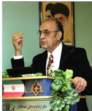
تصویر ۵- سخنرانی در زمینه جنبه های گسترده دانش همه گیری شناسی در دانشکده بهداشت، دانشگاه علوم پزشکی تهران ۱۳۹۰