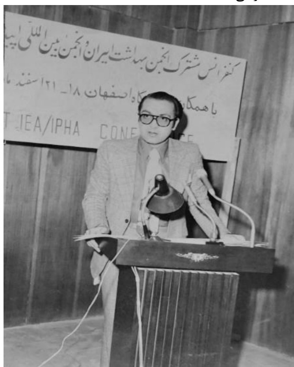
تصویر ۳- سخنرانی در کنفرانس مشترک انجمن بهداشت ایران و انجمن بین المللی اپیدمیولوژی، اصفهان ۱۳۵۵

برنامه ایمن سازی کودکان در سطح کشور اصول مدیریت و انجام عملیات ایمن سازی را فرا گرفتند. مدیر بخش بهداشت مرکز نشر دانشگاهی (۱۳۶۶-۱۳۶۰): ایشان در این سمت، مدیریت و نظارت بر انتخاب و انتشار کتاب های حوزه علوم بهداشتی را به عهده داشت و مجموعه واژگان بهداشت عمومی، که بوسیله انجمن بهداشت ایران منتشر شد و انتشار نسخه فارسی مجله